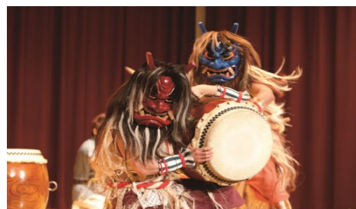
なまはげ太鼓鑑賞のイメージ