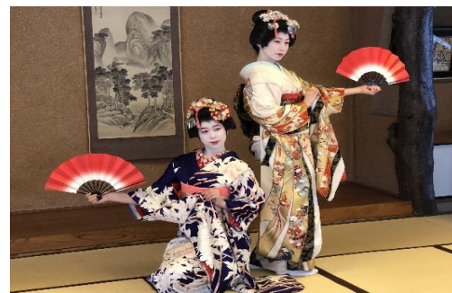
あきた舞妓舞踊鑑賞のイメージ